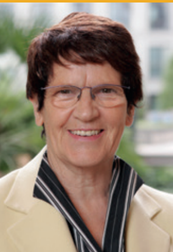
Schirmherrin Prof. Dr. Rita Süßmuth